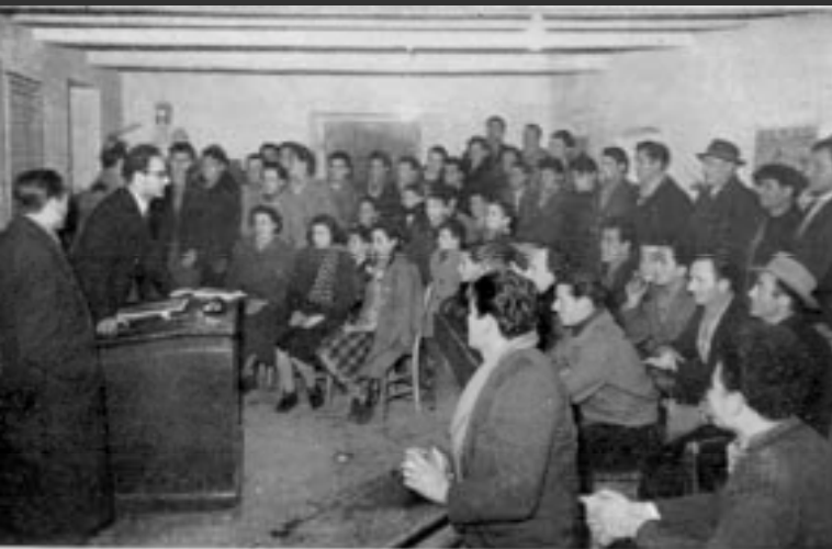
Foto n. 2 - Comprensorio di Poggi - frazione di Fattoria. I partecipanti al corso di prevenzione infortuni durante una lezione

Un esperimento di prevenzione degli infortuni in agricoltura su piano integrale INAIL - 1954