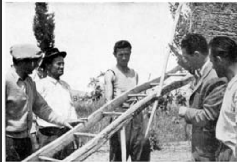
Foto n. 4 - Particolare della scala per pagliato; vengono applicate le aste antioscillanti