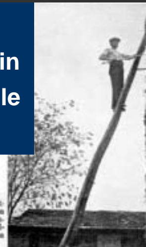
Foto n. 3 - Scala per pagliato munita di due aste di sicurezza da infilare nella paglia; l'accorgimento evita la possibilità di forti oscillazioni e conseguenti cadute della scala.